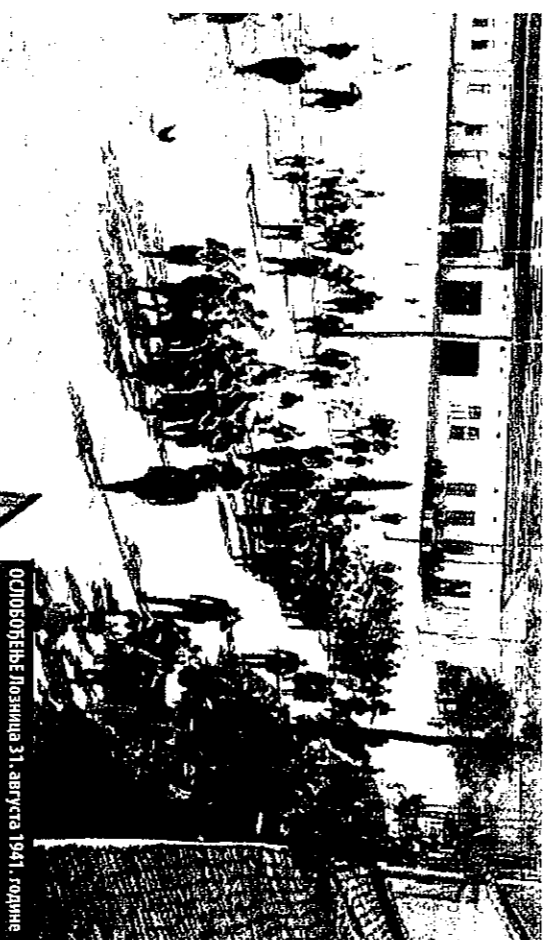
Ослобођење Лознице 31. августа 1941. године

Немци су заробили десеторицу војника и омак их стрељали на лицу места... И на планини Јавор, најпре половином маја, а потом 16. јуна 1941. војне су битке између немачких потерних оделења и српских војника, који се нису враћали кући после калитулације како би извели заробљеништво.