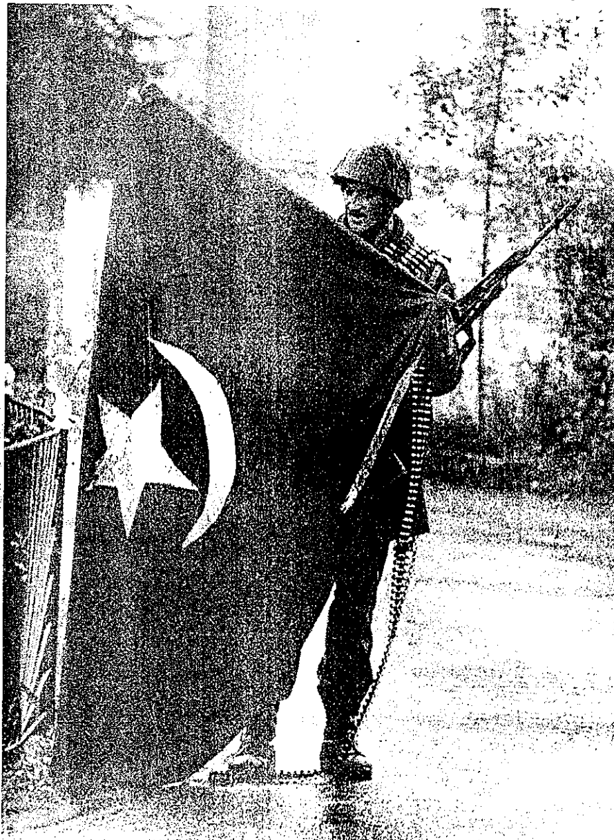
Губици 2 погинулих (Б дан) баталјона и војника

ТГ-2 је цели дан безуспешно покушавала да пронађе слабије брањен положај непријатеља. Промене положаја није било.