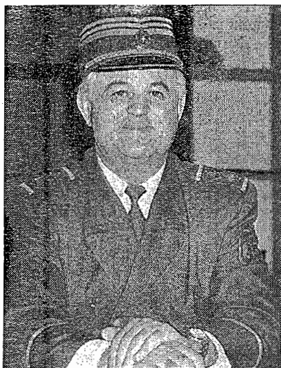
Генерал-пуковник Момир Талић: Да писмо „послушали сами себе“, геноцид би се поновио

Б ила је то битка над биткама. Битка свих битака, како су забиљежили хроничари минулог отаџбинског рата. Пробијање коридора кроз Посавину била је најзначајнија и најспектакуларнија победа бораца Војске РС у отаџбинском рату.