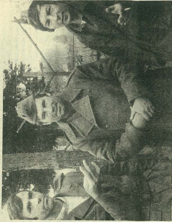
Сјетања на приједени ратни пут