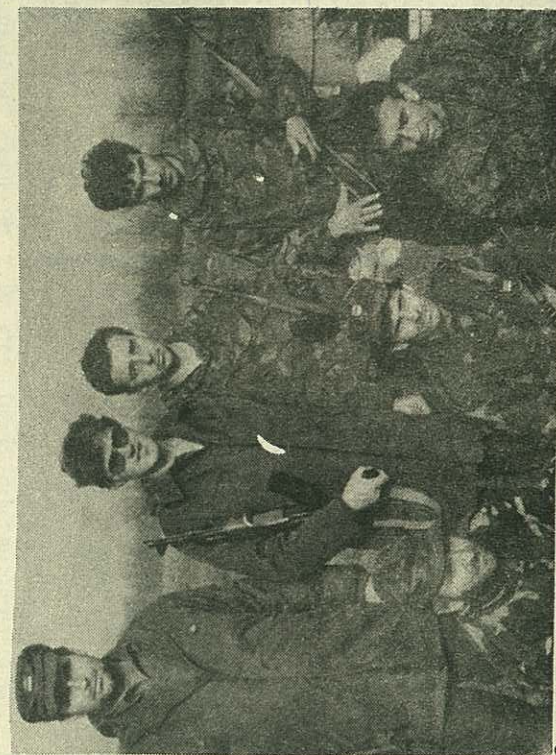
За њих нема несавладљивих препрека