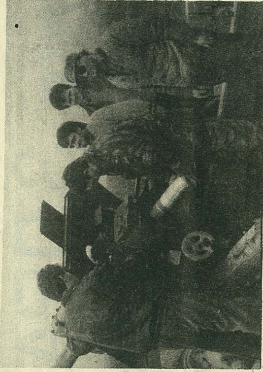
Они су страх и трепет за непријатеља