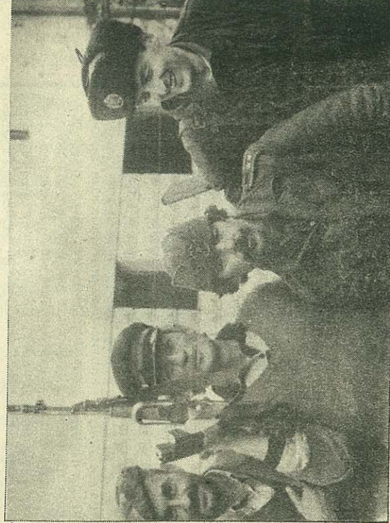
Душмани им ништа не могу