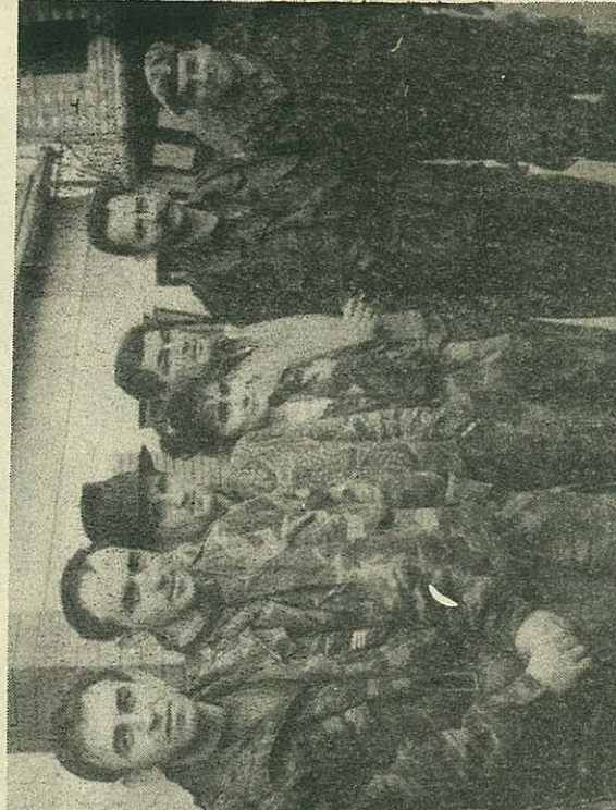
Команда батаљона на окупу